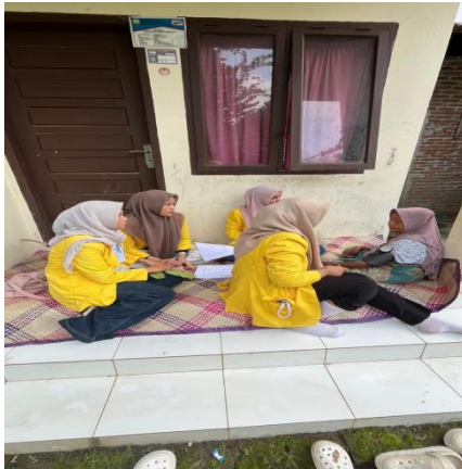
Gambar 2. Pemeriksaan Fisik