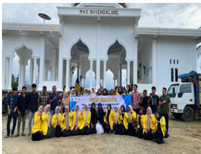
Gambar 5. Edukasi pada remaja