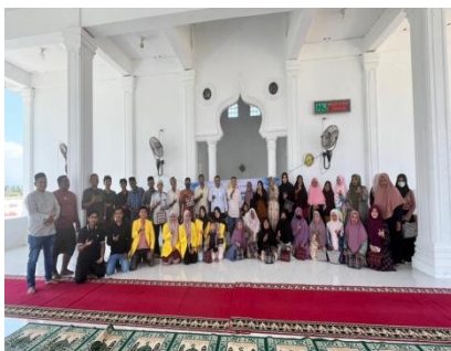
Gambar 8. Edukasi ibu PKK