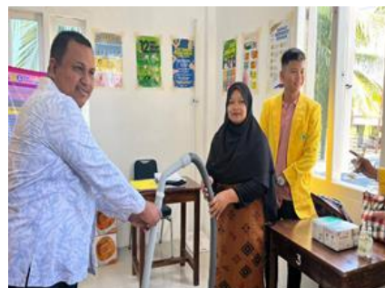
Gambar 9. Penyerahan Pojoy ISPA