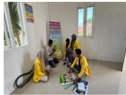
Gambar 6. Penggunaan Partikular Matter