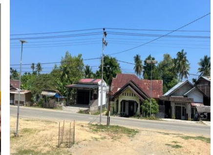
Gambar 10. Kondisi Lingkungan Pasca Intervensi