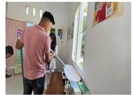
Gambar 7. Aplikasi SIPISPA