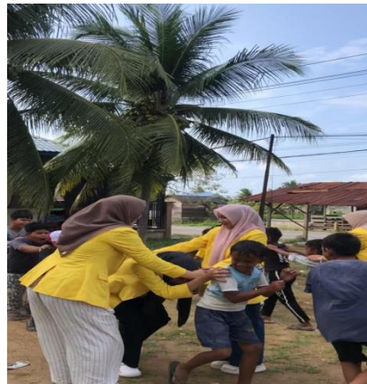
Gambar 3. Trauma Healing