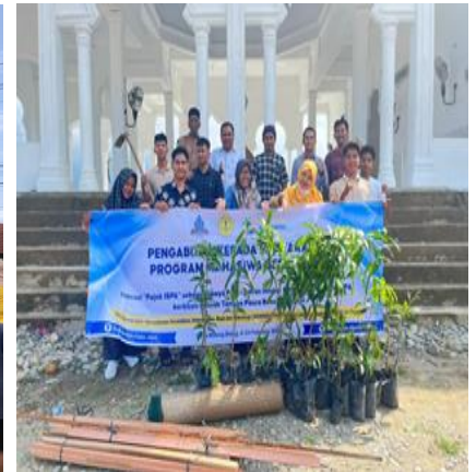
Gambar 4. Penanaman Pohon