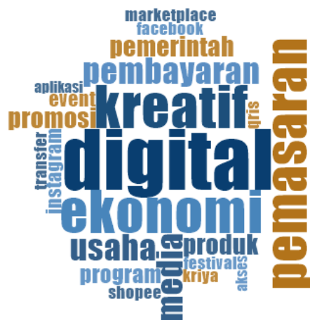
Gambar 3. Visualisasi Hasil Wawancara (Nvivo)

Dominannya kata “digital” menunjukkan bahwa transformasi digital menjadi aspek utama dalam pengembangan ekonomi kreatif di Kabupaten Kutai Kartanegara, yang mencerminkan dimensi innovation dalam konsep smart economy. Pemanfaatan teknologi digital oleh pelaku usaha dan pemerintah terlihat dalam penggunaan media sosial, marketplace, dan aplikasi digital sebagai sarana pemasaran, yang menandai pergeseran dari metode konvensional ke pemasaran berbasis digital serta memperluas jangkauan pasar. Hal ini juga mencerminkan indikator entrepreneurship, yaitu kemampuan pelaku usaha dalam memanfaatkan teknologi untuk meningkatkan daya saing. Selain itu, tingginya penggunaan sistem pembayaran digital seperti transfer bank, dompet digital, dan QRIS menunjukkan peningkatan efisiensi transaksi yang sejalan dengan indikator productivity. Peran pemerintah juga terlihat melalui berbagai program, event, festival, dan promosi yang mendukung pengembangan ekonomi kreatif serta memperkuat citra daerah. Kondisi ini mencerminkan indikator economic image dan branding dalam smart economy, yang menekankan pentingnya promosi dan identitas ekonomi daerah dalam meningkatkan daya saing.