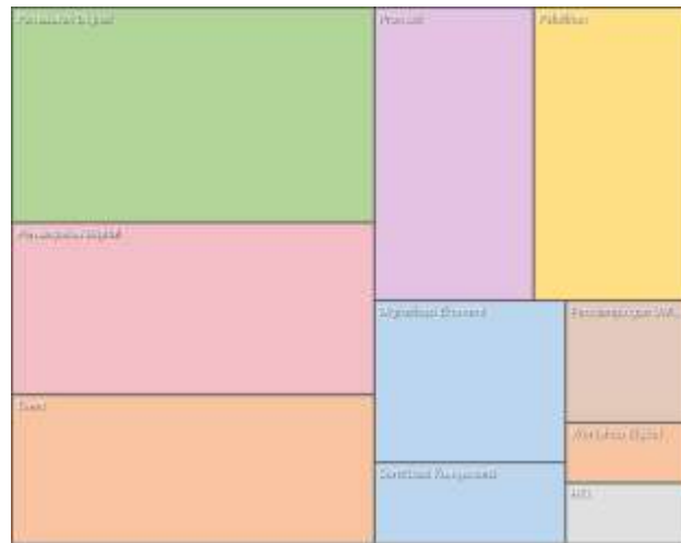
Gambar 4. Hierarchy Chart (Nvivo)

Hasil penelitian menunjukkan bahwa pemasaran digital menjadi strategi utama dalam pengembangan ekonomi kreatif di Kabupaten Kutai Kartanegara, karena mampu memperluas jangkauan pasar dan meningkatkan efektivitas promosi. Pemanfaatan media sosial dan marketplace oleh pelaku usaha mencerminkan transformasi menuju ekonomi digital sebagaimana dikemukakan oleh Don Tapscott (1996), di mana teknologi memungkinkan proses pemasaran dan transaksi menjadi lebih efisien, cepat, dan luas. Pada subsektor kuliner, digitalisasi terlihat melalui penggunaan Facebook dan QRIS; pada seni kriya melalui Shopee dan Instagram sebagai sarana promosi sekaligus interaksi konsumen; serta pada seni pertunjukan melalui Instagram dan TikTok yang meningkatkan popularitas dan jangkauan audiens. Temuan ini juga sejalan dengan teori daya saing oleh Michael E. Porter (1990), di mana keunggulan kompetitif tercermin dari diferensiasi produk dan efisiensi operasional. Diferensiasi terlihat pada produk kriya yang handmade , seni pertunjukan berbasis budaya lokal, serta kuliner khas seperti kue keroncong Tenggarong, sementara efisiensi operasional didukung oleh pemanfaatan teknologi digital dan pembayaran non-tunai. Namun, implementasi pemasaran digital belum optimal karena masih terdapat kendala seperti rendahnya literasi digital pelaku usaha (terutama usia di atas 40 tahun), keterbatasan jaringan internet, serta belum tersedianya platform digital khusus dari pemerintah daerah.